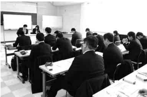
渉外担当者研修会

けんしんの業績を担う若い渉外担当者たちは、互いに競い合い業績向上に貢献しています。当組合の発展には人材の育成は欠かせません。職位別・職能別・テーマ別に集合研修や職場内研修を実施しています。令和元年度は融資推進・事務資質向上・OJT実践のための人材育成を目的に研修会を重点的に実施しました。また、コンプライアンス体制確立のため、遵守すべき法令等の徹底などを目的に役職員研修を実施しています。