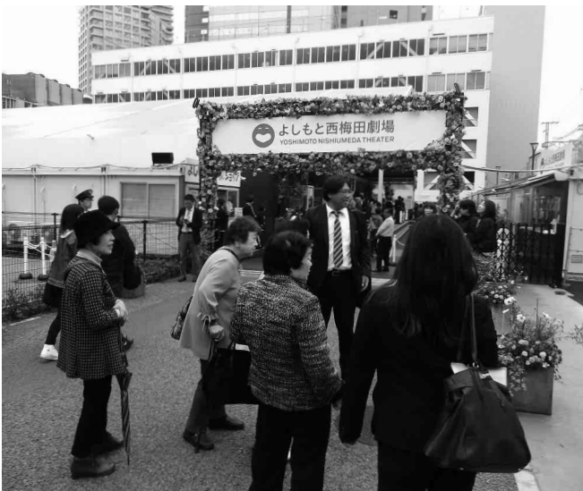
「信悠クラブ」親睦旅行

“ふぐ料理日本一「づぼらや」ふぐ会席と吉本お笑いライブ”と題し、新喜劇鑑賞とふぐ会席をお楽しみいただきました。